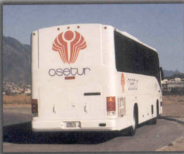
Vista posterior de la unidad

Integral, fabricada en acero tubular Lámina aluminizada Prime Plus cal. 2 Lámina galvanizada recubierta con al Lámina galvanizada recubierta con al Espuma de Poliuretano toda la unida Juego de 49 asientos reclinables ma Con sistema neumático y cinturón d Triplay de 3/4 " tratado. Linolium antiderrapante de alta resis Puerta basculante tipo pantógrafo Panorámicas con cristales templado Panorámico de 2 piezas de vidrio tint Neumático tipo pantógrafo con aspe Electrónico programable. Con luz fluorescentes en portabultos Luces de galivo de acuerdo a norma Color de acuerdo a tapicería en piez Pintura en un tono marca Standox. Instalado al frente de la unidad. De una pieza, reforzadas con acero Dos exteriores de lujo tipo cuerno. De 12 volts. 12 volts. De lujo preparados para aire acondi Tres cajuelas para equipaje con Instrumentos marca VDO, tacó Dos ventilas de Techo: Lámina de aluminio liso Cal. 1/8", cu