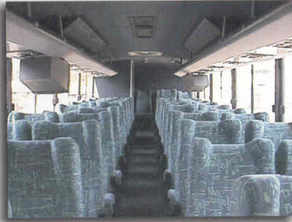
Vista interior de la unidad Equipada