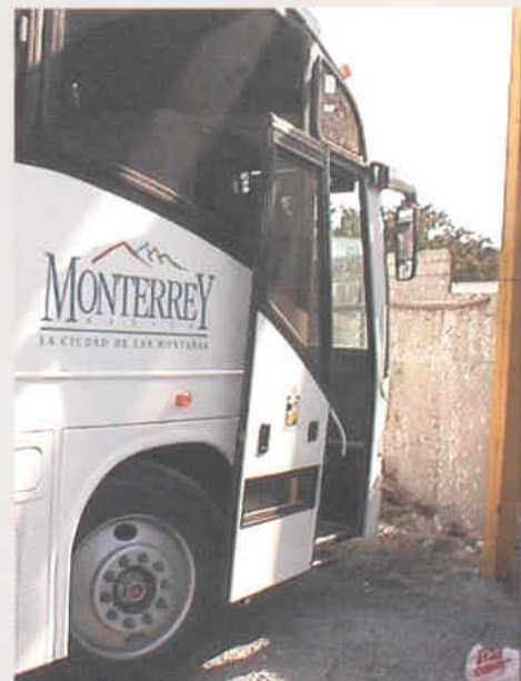
Diseño funcional de la puerta principal tipo pantografo

ubierta de antiderrapante, con bandas de seguridad en plástico color amarillo.