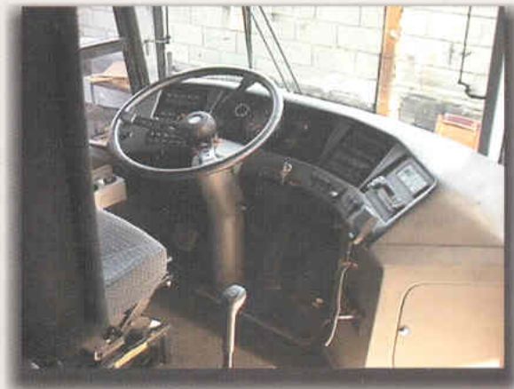
Compartimiento del conductor consola panorámica instrumentos al alcance del operador